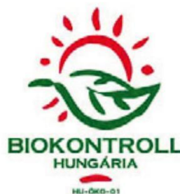
Hazai tanúsító szervezetek logói