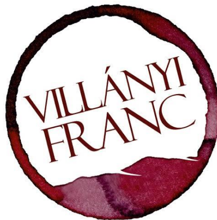
23. ábra: Villányi franc logó

Premium és Super Premium Cabernet franc borok esetén kötelező a 32. ábra szerinti logó használata a front címkén. A logó grafikai megjelenése legalább 2,0 cm legfeljebb 3,0 cm átmérőjű lehet, amelyet a front címke jobb alsó harmadában kell elhelyezni. A főcímkén az 1. ábra szerinti Villányi DHC logót a feltüntetésére vonatkozó előírásoknak megfelelően kell elhelyezni, valamint az alábbi mondatot kell feltüntetni: a főcímkén: „A Villányi Franc az elegancia és a harmónia megtestesítője.” és angolnyelvű megfelelőjét: „Villányi Franc is the embodiment of elegance and harmony.”