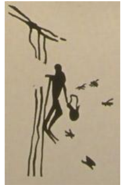
Kb. 16 000 éves barlangrajz